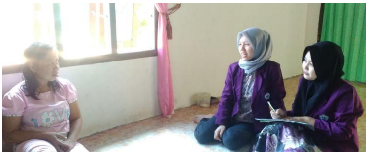
Gambar 2. Survei Keluhan Penyakit Warga

Kegiatan pengabdian kepada masyarakat ini dilaksanakan pada tanggal 18 Februari 2019 sampai dengan 9 Maret 2019. Lokasi kegiatan ini adalah Desa Teluk Jambu Kecamatan Taman Rajo Kabupaten Muaro Jambi. Pelaksana dari Kegiatan Pengabdian ini yaitu mahasiswa KKN program studi Farmasi STIKES Harapan Ibu Jambi dan masyarakat di Desa Teluk Jambu Kecamatan Taman Rajo Kabupaten Muaro Jambi.