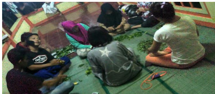
Gambar 5. Pembuatan Produk Bersama Warga

Setelah itu dilaksanakan praktek langsung pembuatan produk herbal yang diantaranya adalah pembuatan minyak kelapa. Selain minyak kelapa juga dibuat produk herbal lainnya seperti teh daun salam sebagai pilihan alternatif untuk pengobatan asam urat, hipertensi, diabetes dan gantungan pengusir nyamuk, sebagai alternatif untuk mengurangi nyamuk dan produk Kunyit asem sebagai obat demam dan tidak enak badan, menambah stamina.