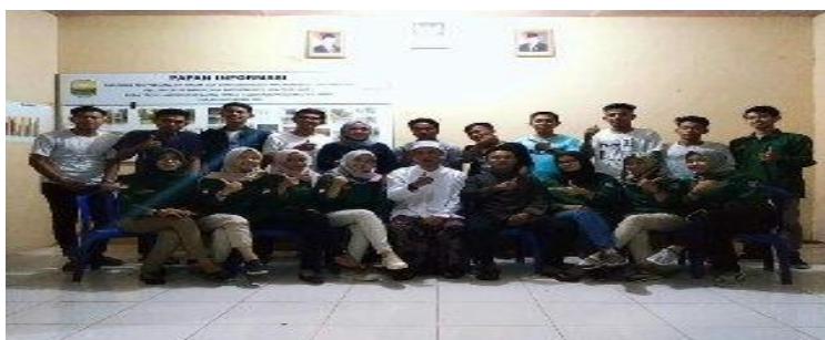
Gambar 3. Musyawarah Masyarakat Desa di Kantor Desa Teluk Jambu

Tahapan pelaksanaan pengabdian masyarakat ini adalah dimulai dari survei awal (Gambar 2), kemudian tim pengabdian kepada masyarakat melakukan musyawarah masyarakat desa sama kepala desa dan warga desa (Gambar 3). Setelah melakukan musyawarah tim pengabdian bersama masyarakat mempersiapkan kebutuhan untuk melakukan sosialisasi mengenai penyakit gatal dan pemanfaat minyak kelapa untuk mengatasinya.