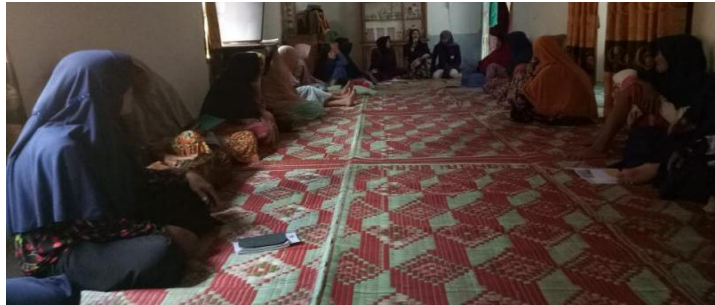
Gambar 4. Sosialisasi Penyakit Kulit

tahapan dan cara yaitu, melakukan pendekatan komunikasi kepada masyarakat secara langsung untuk meningkatkan pengetahuan mengenai penyakit, memberikan informasi dengan cara langsung tentang apa itu penyakit gatal/kulit, penyebab dan cara pencegahannya, memberikan informasi kepada masyarakat mengenai obat-obatan herbal untuk penyakit kulit atau gatal, khasiat dan cara menggunakannya dan memberikan informasi kepada masyarakat mengenai PHBS.