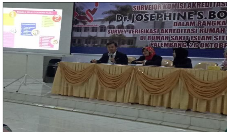
Gambar 1. Pelaksanaan Diseminasi Ilmu Tentang Supervisi Keperawatan

Kegiatan diseminasi ilmu dengan konsep seminar sehari dengan tema “ Peningkatan Mutu Pelayanan Keperawatan Berorientasi pada Pelaksanaan Metode Team dan Aplikasi Pendokumentasian Asuhan Keperawatan” di Aula Rumah Sakit Islam Siti Khadijah Palembang sekaligus sosialisasi format supervisi keperawatan dilakukan pada tanggal 28 Oktober 2017, adapun kegiatan dihadiri oleh 60 orang peserta, tujuan dari presentasi materi dan sosialisasi format supervisi ini adalah untuk meningkatkan pengetahuan karu dan perawat ruangan tentang supervisi keperawatan serta mensosialisasikan instrument atau format supervisi keperawatan. Dapat dilihat pada Gambar 1 dan Tabel 2.