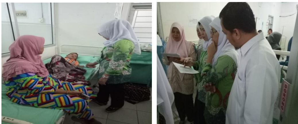
Gambar 6. Kegiatan Supervisi Keperawatan Secara Langsung