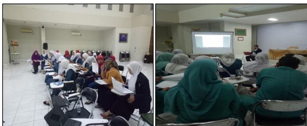
Gambar 3. Sosialisasi Kegiatan Supervisi Keperawatan

Kegiatan sosialisasi Supervisi Keperawatan dilaksanakan di Aula RSI Siti Khadijah Palembang pada tanggal 13 November 2017 yang dihadiri oleh 11 karu serta katim dan komite keperawatan serta bidang keperawatan. Adapun output kegiatan tersebut tersosialisasinya panduan supervisi di ruang Madinah dan peserta mengetahui dan mampu mendemonstrasikan panduan supervisi (Gambar 3).