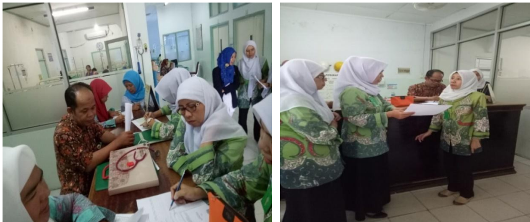
Gambar 5. Kegiatan Diskusi Formal dan Sosialisasi Karu ke Perawat Pelaksana