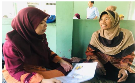
Gambar 1. Penyuluhan dengan menggunakan leaflet dan pembagian kuesioner