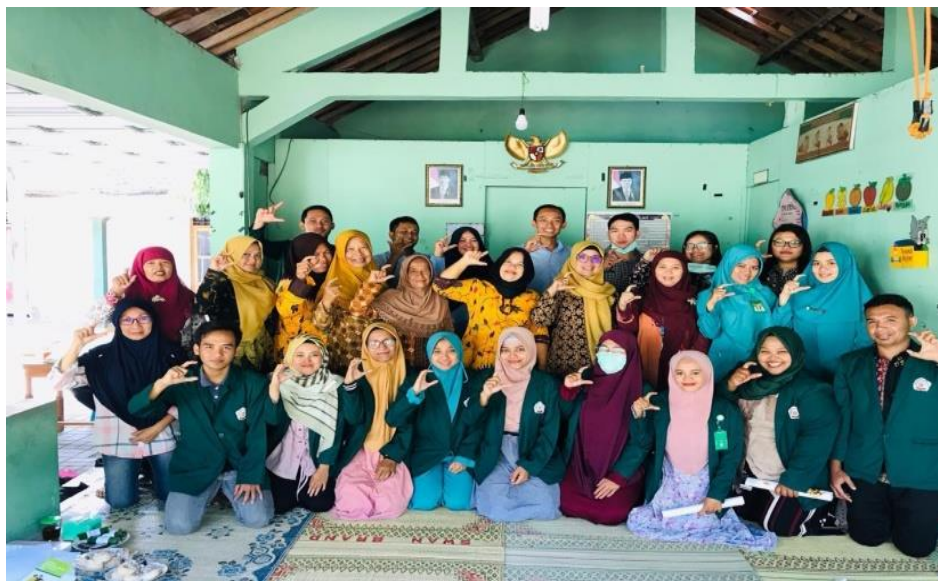
Gambar 3. Penyuluhan Kesehatan dan Evaluasi Bersama dengan Tim dari Puskesmas Bambanglipuro ,Bantul