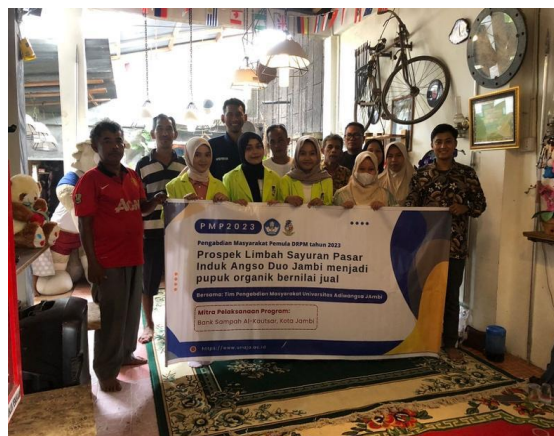
Gambar 2. Penyuluhan tentang prospek limbah sayur untuk dijadikan pupuk cair