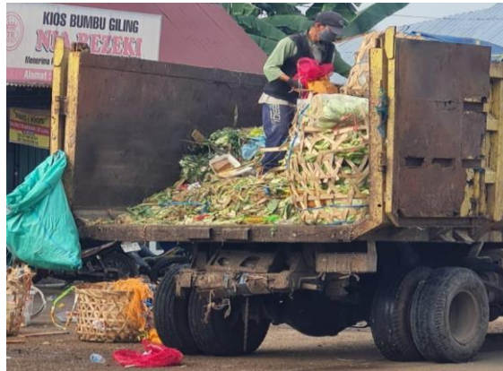
Gambar 1. Limbah Sampah Pasar Angso Duo Jambi

Limbah sampah sayur yang masih banyak dan belum dimanfaatkan dengan efektif.